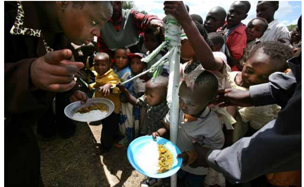
Bambini fanno la fila per ricevere cibo a Nakuru, Kenya. Migliaia di persone sono state sfollate in seguito alla recente violenza.