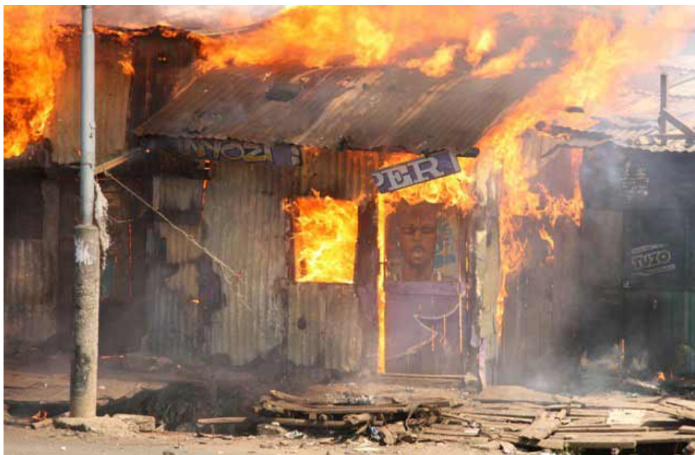
La bottega di un barbiere brucia nello slum di Mathare durante la violenza post-elettorale, 31.12.2007.