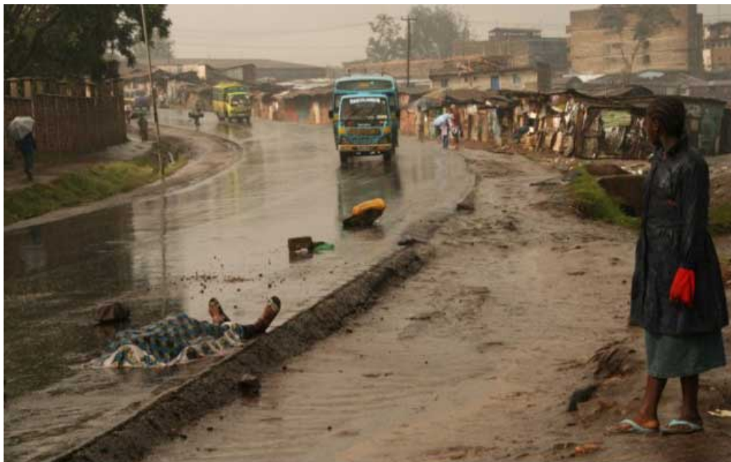
Il corpo di una vittima delle violenze post-elettorali giace in Juja Road, vicino all slum di Mathare, Nairobi, Kenya, gennaio 2008.