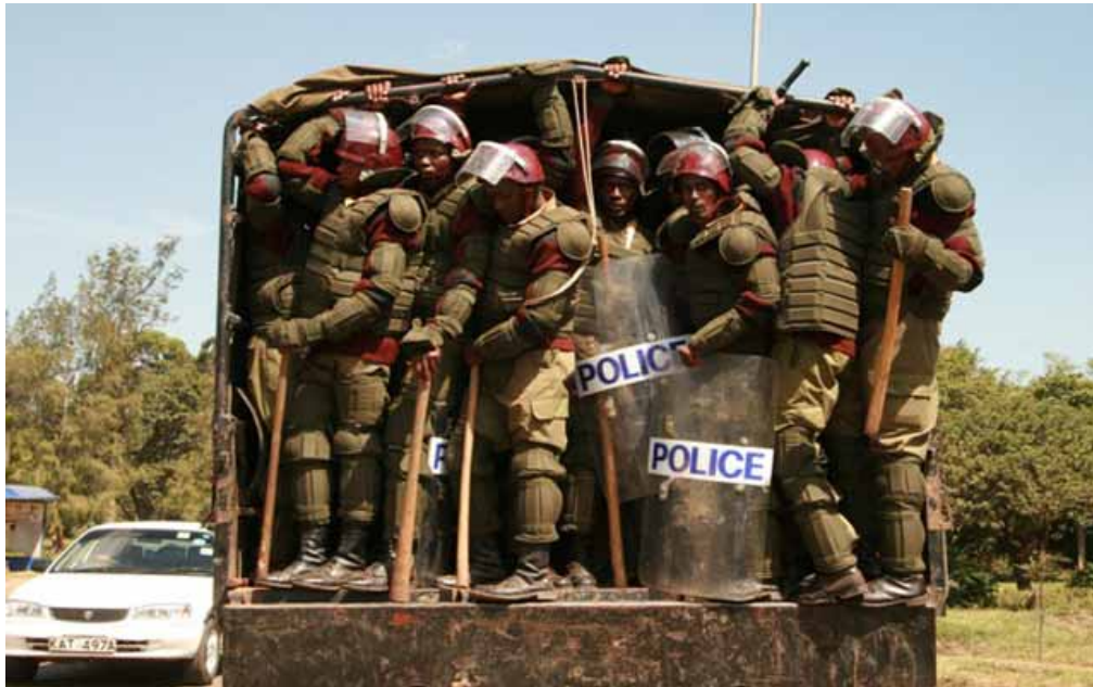
Polizia antisommossa chiamata a controllare i manifestanti durante una cerimonia funebre di persone uccise durante la violenza post-elettorale a Ligi Ndogo, Nairobi, Kenya, Gennaio 2008.